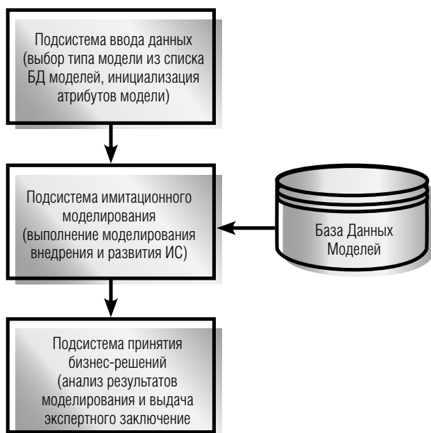
Рис. 1. Схема взаимодействия модулей системы

Общая схема взаимодействия модулей системы представлена на рис. 1